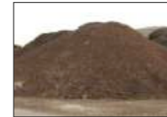
Materias primas de calidad.