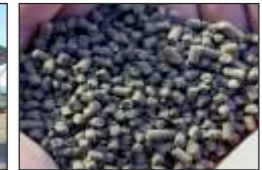
Presentación de producto.