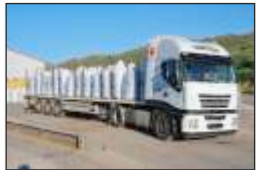
Expedición de producto.